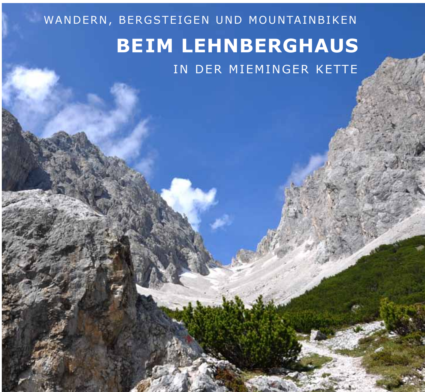
Blick zur Grünsteinscharte