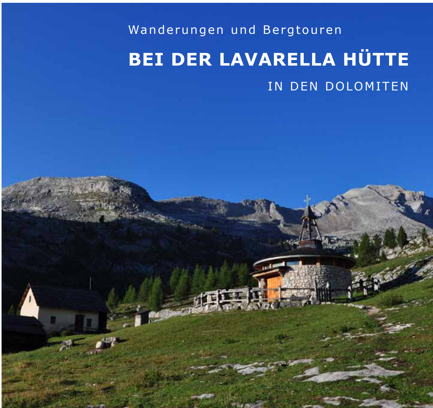
Kleine Fanesalm mit der Limospitze und Piz Stiga