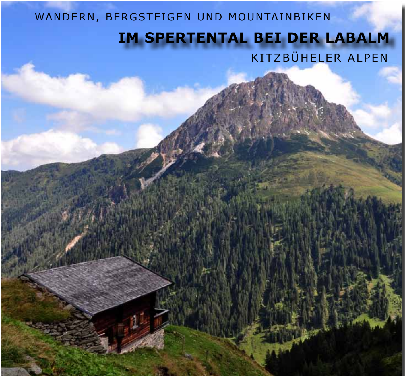
Blick zum Großen Rettenstein