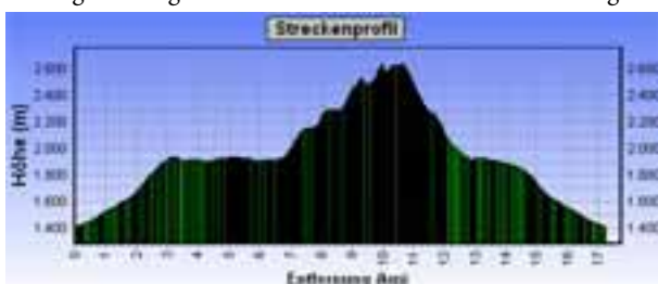
Bergtour: Stigleith - Hundstsee - Weißstein - Rosskogel