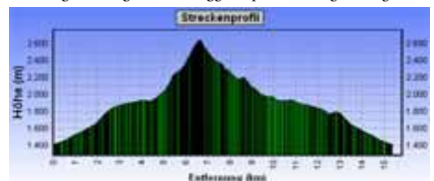
Bergtour: Stigleith - Ranggerköpfl - Rosskogel - Kögele