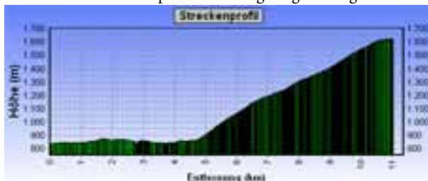
MTB-Tour: Oberperfluss - Inzing Berg - Inzinger Alm