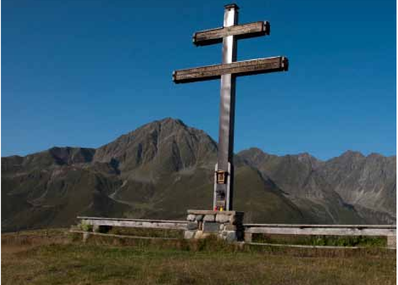
Ranggerköpfl mit dem Rosskogel