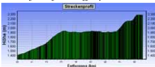
Bergtour: Stigleith - Ranggerköpfl - Hundstsee