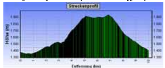
Bergtour: Stigleith - Krimpenbachalm - Ranggerköpfl