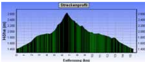
Bergtour: Stigleith - Rosskogel - Kögele - Krimpenbachalm